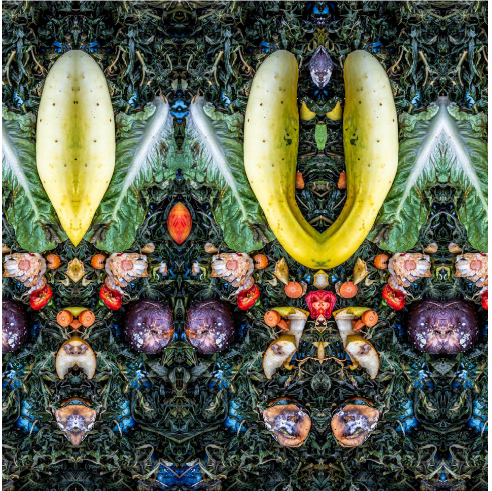
The Horror Clown arrives in a rubber dinghy (part two)