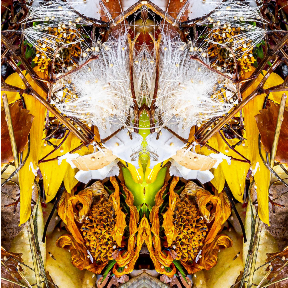
The White Witch burns on a funeral pyre.