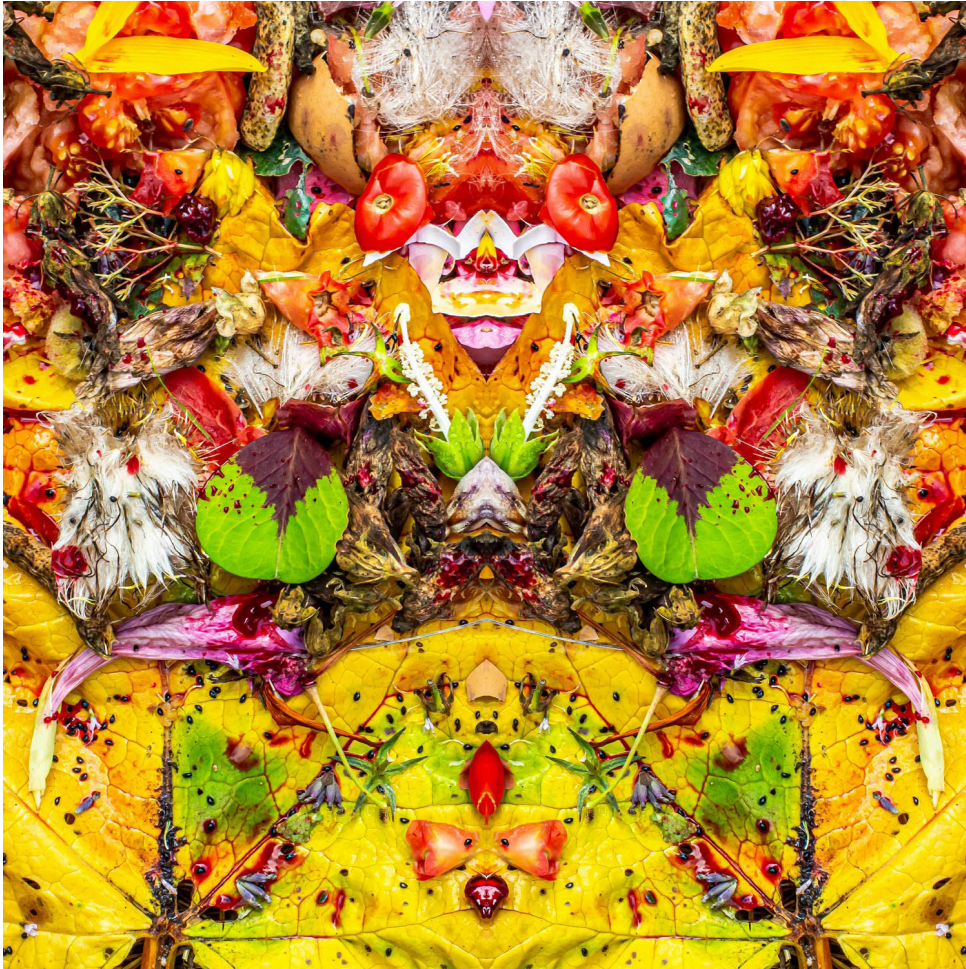
Surrealistisch Psychedelische Photographien Klaus Sierpman