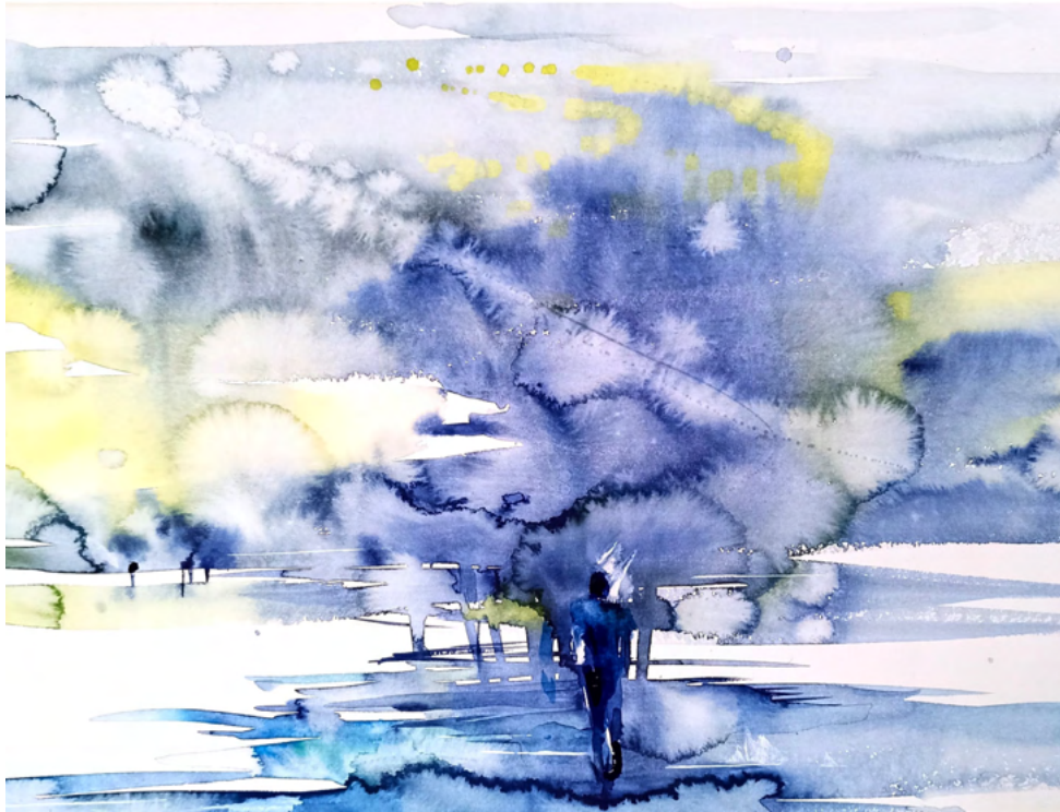
Serie „Garten Aquarell“, Papier 36x48 cm, 2022