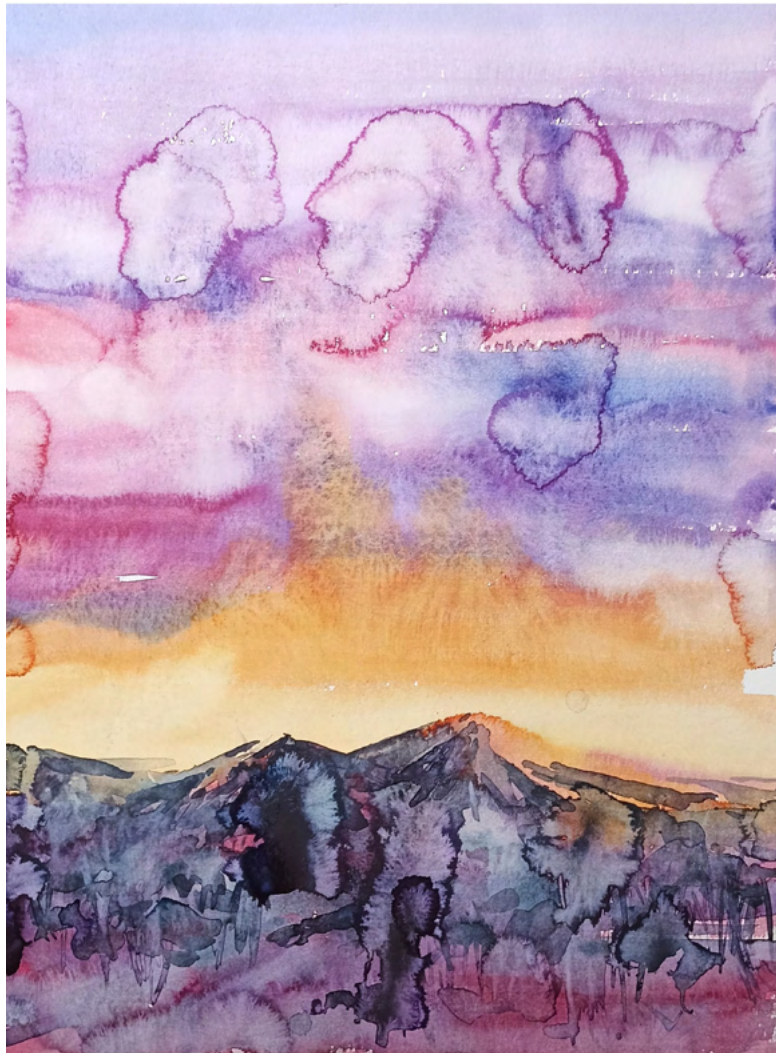
„Abend auf Lanzarote“, Aquarell auf Papier, 48x36 cm, 2023