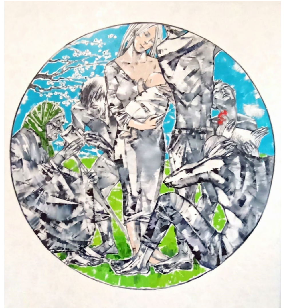
„Hoffnung auf den Frühling 2“, Öl auf Leinwand, 200x 180 cm, 2022