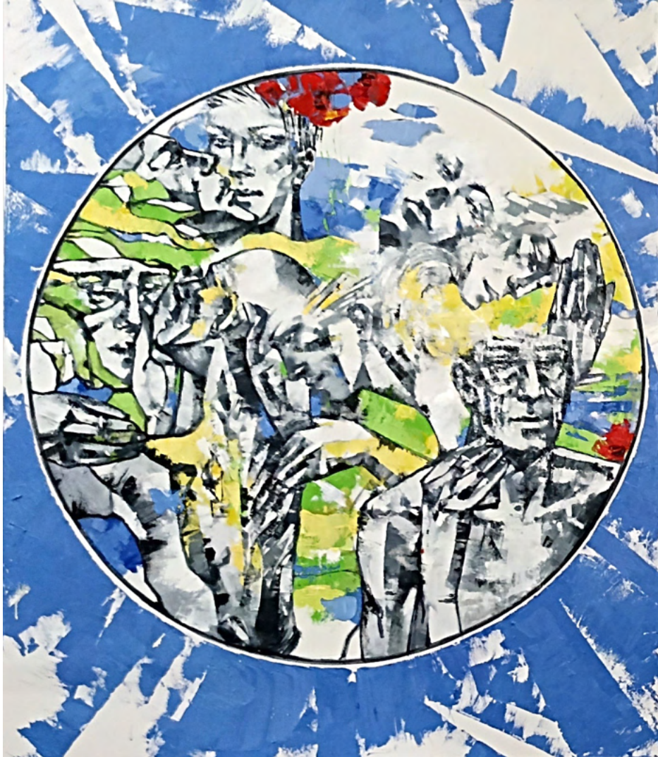
„Hoffnung auf den Frühling 4“, Öl auf Leinwand, 120x100 cm, 2022