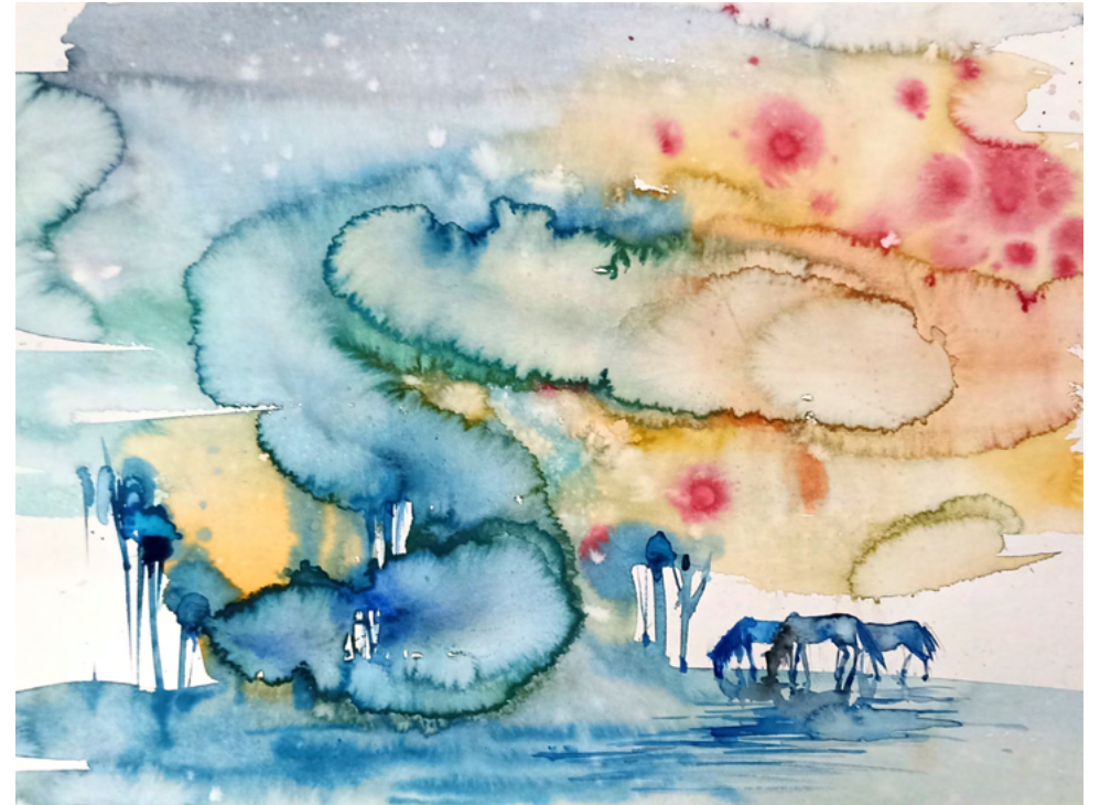
Serie „Garten Aquarell“, Papier 36x48 cm, 2022