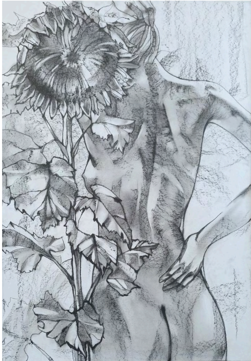
„Die Schönheit“, Graphitstift auf Papier, 100x70 cm, 2022