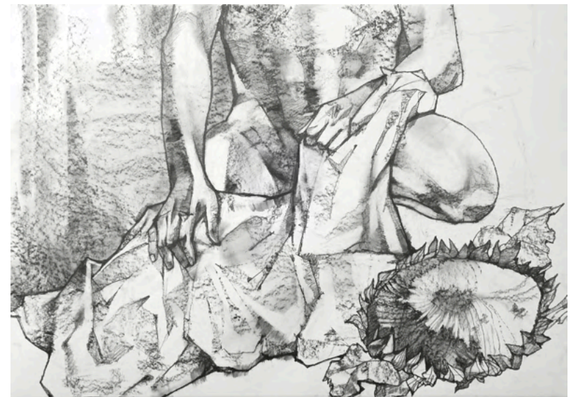
„Die Stärke“, Graphitstift auf Papier, 70x100 cm, 2022